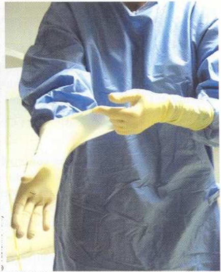
Figure 8. Gantage chirurgical. On recommande aussi la méthode d'habillage et de gantage "fermée".