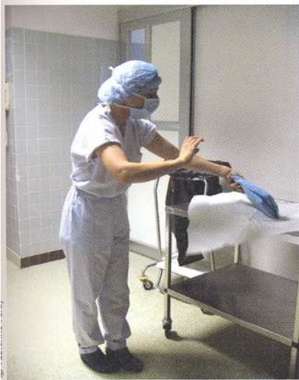
Figure 6. Préhension des packs contenant la blouse opératoire. Avoir les mains parfaitement sèches.