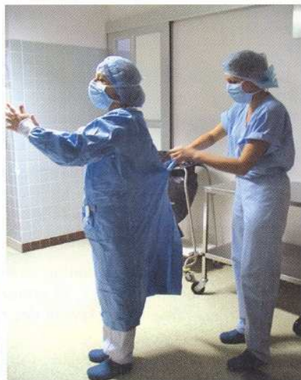
Figure 7. Habillage chirurgical. L'infirmière circulante ne doit toucher que les lanières du dos.