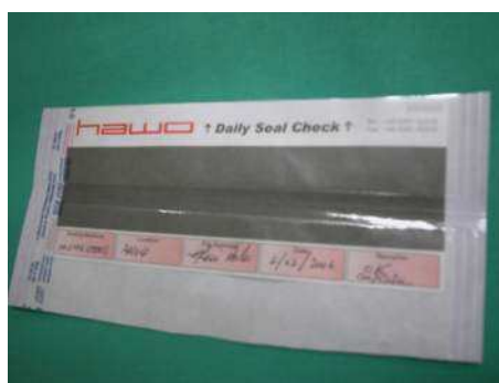
Test soudeuse « Seal Check