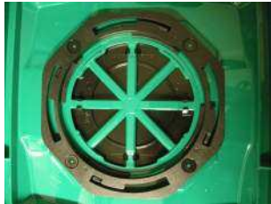
Conteneur sans filtre