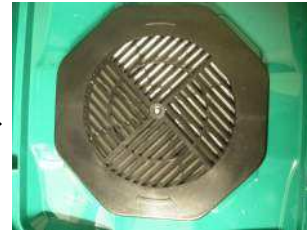
Conteneur avec filtre et grille