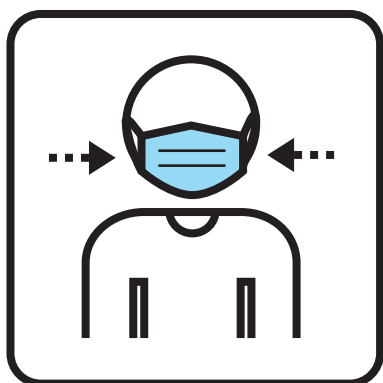
Port du masque de soins

Déclarez vos symptômes à votre arrivée et respectez les consignes suivantes :