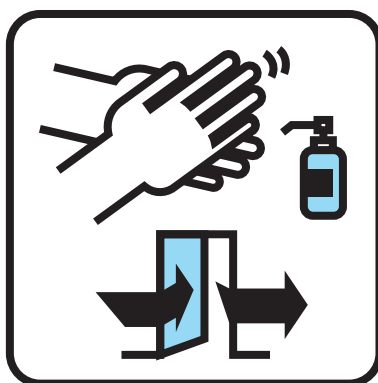
Désinfection rigoureuse des mains à l'entrée et à la sortie de la chambre